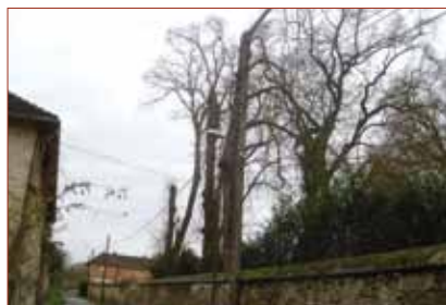
- Chemin de la Paroisse