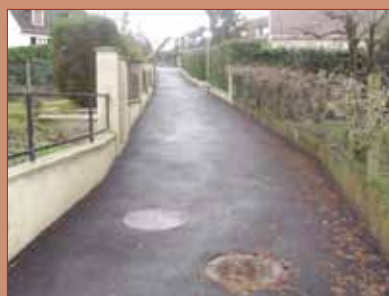
- Réfection totale de la voirie avec création d'un réseau d'eau pluvial : Sente des Commissions