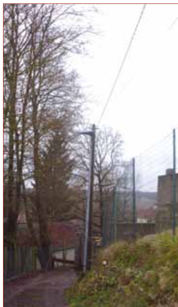
- Création d'un éclairage à l'entrée et dans la Sente du Clos Pinard