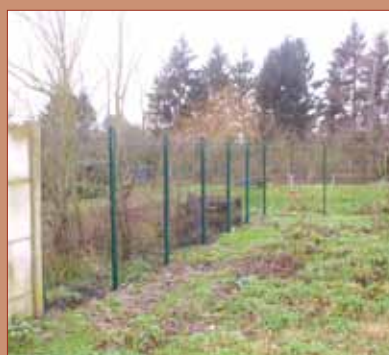
- Mise en clôture du futur terrain pédagogique des écoles