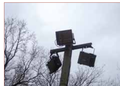
- Amélioration de l'éclairage du Terrain de Boules