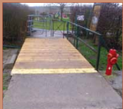
- Réfection du Pont Parc Paysager