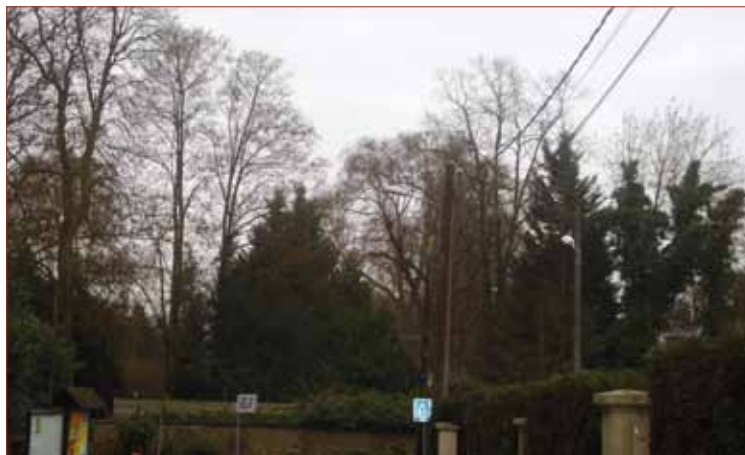
- Renforcement de l'éclairage au virage rue la Guillotte