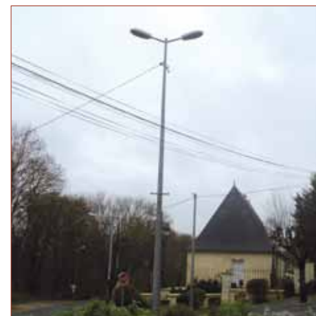
- Rond point et Rue des Nonnains