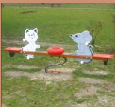
- Jeux individuels Parc Paysager