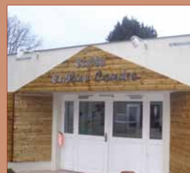
- Aménagement de l'entrée salle polyvalente