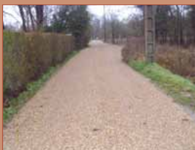
- Réfection du chemin des Brulis