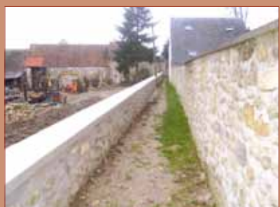
- Réfection totale du mur Sente De La Fontaine environ 40 ml