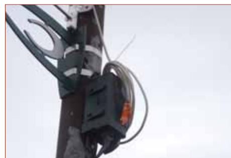
- Mise en place de prises électriques avec protection différentielle sur les poteaux recevant les illuminations de fin d'année