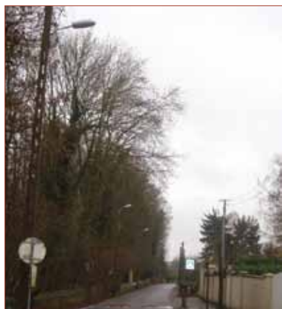
- Rue la Guillotte (haut)